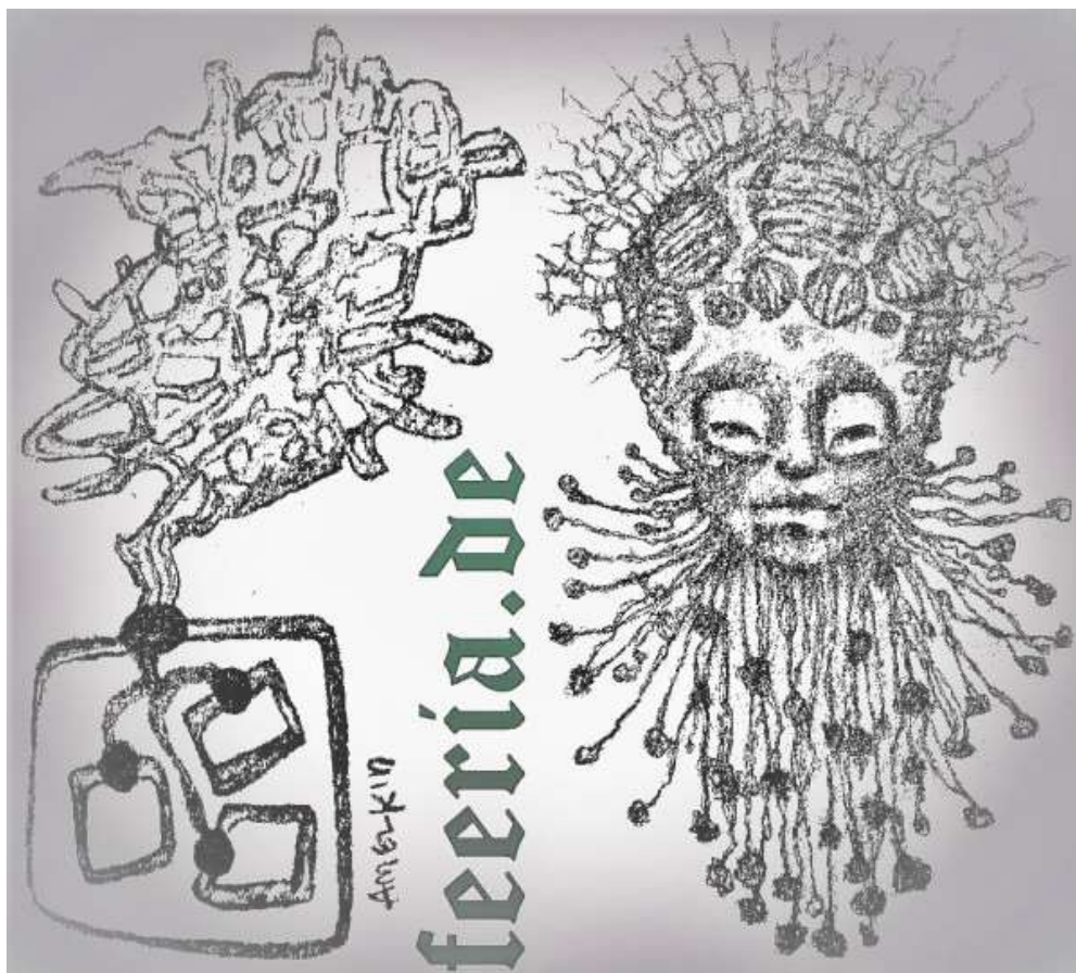
Extrasomatisches Bewusstsein (das äußere "Gehirn") und intrasomatisches Bewusstsein des Subsystems sind durch einen Knoten verbunden.

Wenn Sie einen bereits betagten Menschen erneut mit seinem alten Muster verwechseln, können Sie den Wunsch nach einer allmählichen Rückkehr des Körpers in seinen vorherigen Zustand erfüllen. Mithilfe des Mechanismus des Langzeitgedächtnisses kann man ein Muster verschlungener Körperpartikel aus der Kindheit und Jugend lokalisieren (erkennen) und mit ihnen arbeiten, um den Körper entsprechend einem lokalisierten Muster neu zu programmieren und neu zu verschränken.